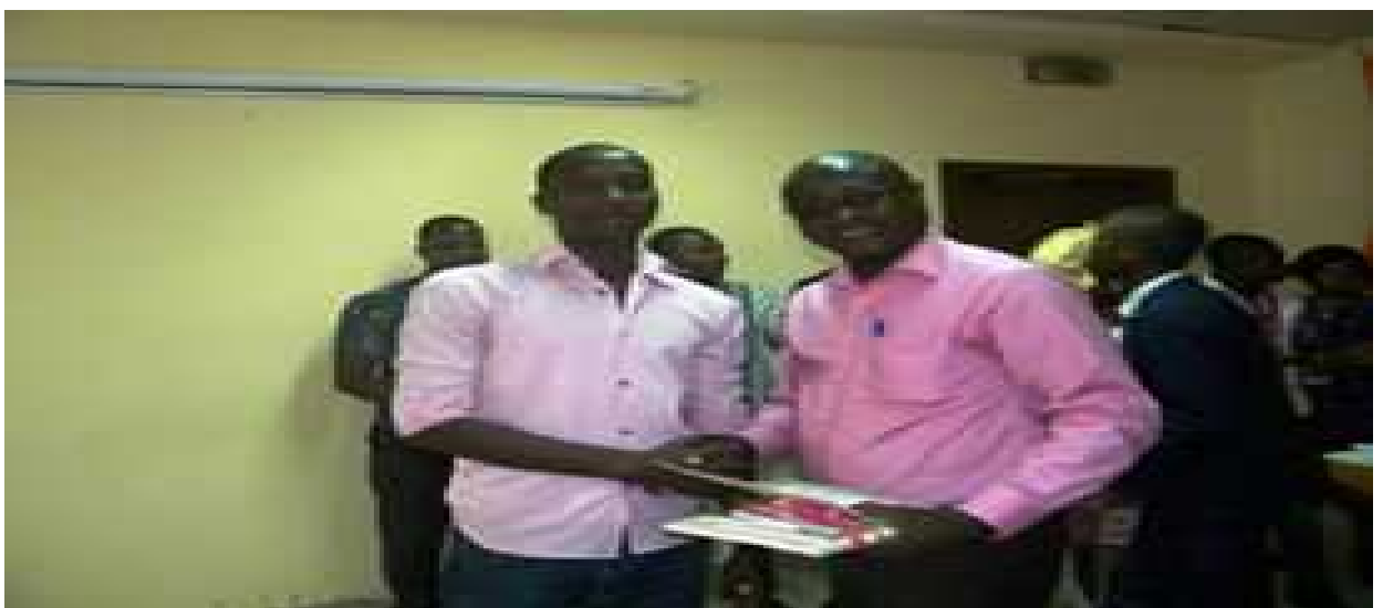
Célébration des meilleurs...