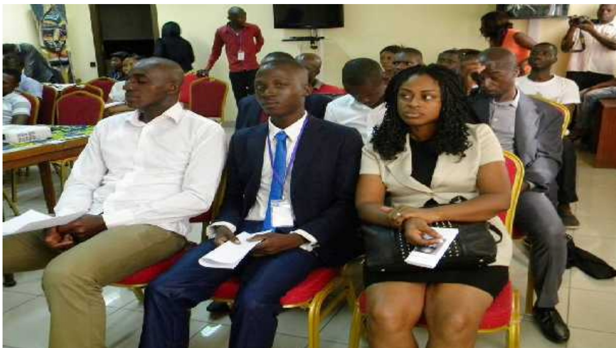
Le président d'Ivoire Club Ecriture entouré du Directeur du livre et de la directrice de la Radio Bien-être.