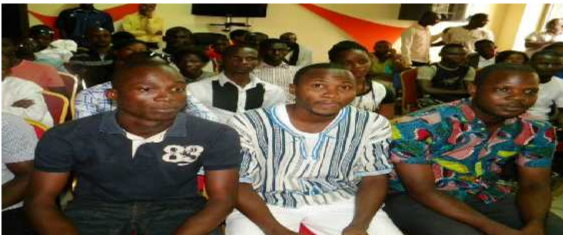
Le public très attentif